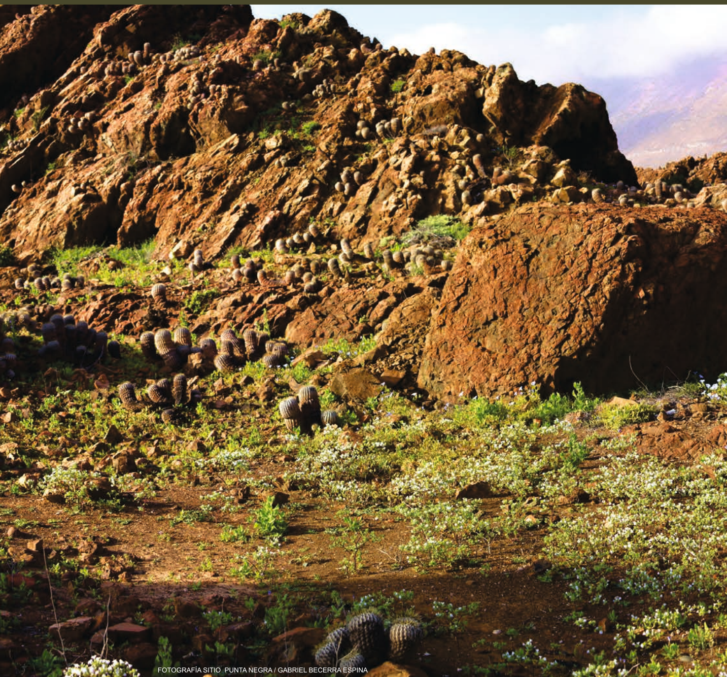
FOTOGRAFIA SITIO PUNTA NEGRA

Revista Taltalia del Museo Augusto Capdeville Rojas de Taltal N° 3 Año 2010