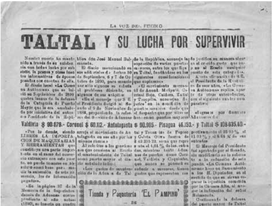
Figura 3. Diario La Voz del Pueblo, Taltal. 12 de julio de 1958.

unos 9.000 trabajadores y su exportación no sobrepasaba el millón de toneladas, muy por debajo de los tres millones que exportó en sus mejores años. La producción nacional era sostenida básicamente por las oficinas con tecnología Guggenheim: María Elena y Pedro de Valdivia. Mientras tanto en Taltal sólo sobrevivirá la Oficina Alemania, aunque no por muchos años (Figura 3).